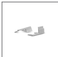
Záslepka KRAV-05IN šedá Ref: 24308