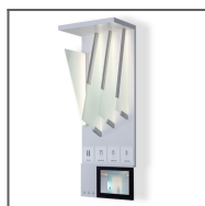
Panel P230-90177M Ref: 90177M