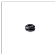
Gumová průchodka 6,4x1,6 Ref: 00802L