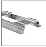
Profil RAM- KOZE-100 Ref: 18057