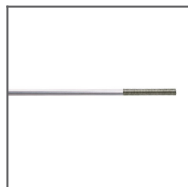
Držák K0G-AB Ref: 42102