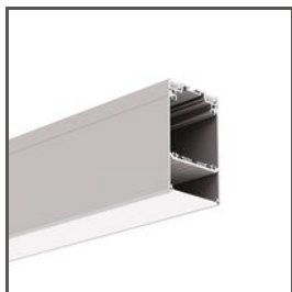
DES A18030 Ref. arch 18030