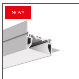
FOLED-50-BOK A0A57945 Ref. arch SA57945