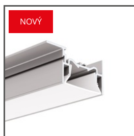
FOLED-50-SUF A03631 Ref. arch C3631