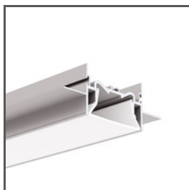
FOLED-50 A03632 Ref. arch C3632