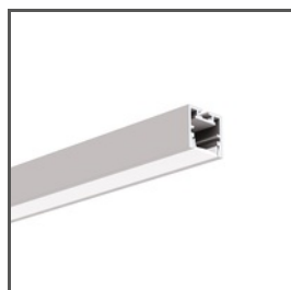
PDS-ZM-PLUS A02056 Ref. arch C2056