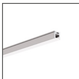
PIKO-ZM A01168 Ref. arch C1168