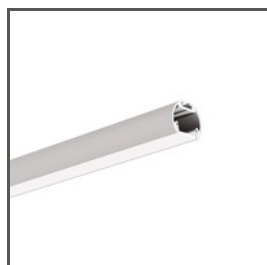
OLEK A08505 Ref. arch B8505