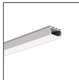
GIZA-LL A00758 Ref. arch C0758