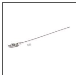
BEZPEČNOSTNÍ KABEL ZM-2 Z70521 Ref. arch 70521