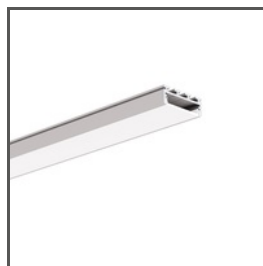
GIZA A05556 Ref. arch B5556