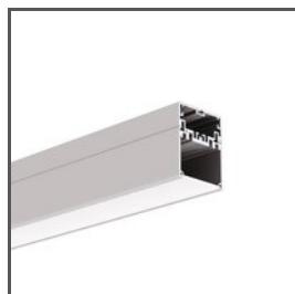
4050 A18050 Ref. arch 18050