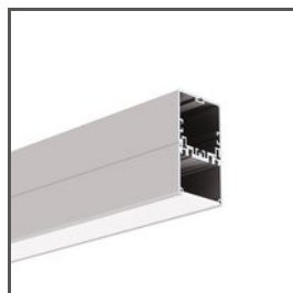
4050-W A18051 Ref. arch 18051