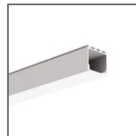
LIPOD A05554 Ref. arch B5554