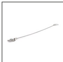
BEZPEČNOSTNÍ KABEL ZM-1 Z70520 Ref. arch 70520