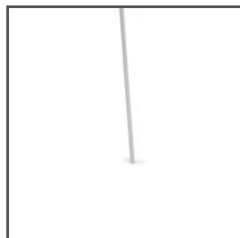
PRUT FI-3-ALU C28196A01, C28196A07 Ref. arch 42526, 42527, 42528, 42529