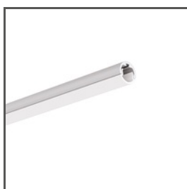
PIKO-O A01167 Ref. arch C1167