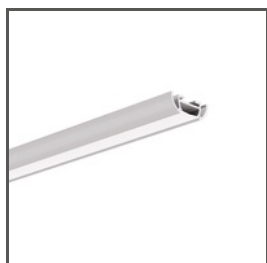
TOST A05393 Ref. arch B5393