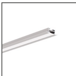
TAKO A05392 Ref. arch B5392