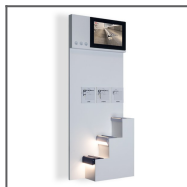
Panel P230-90108M Ref: 90108M