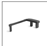
Záslepka STEKO-L černá Ref: 24246