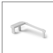
Záslepka STEKO-P šedá Ref: 24037