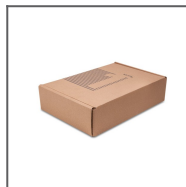
Prezentační box 1 Ref: 90051