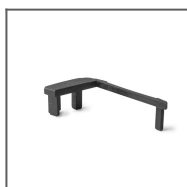
Záslepka STEKO-P černá Ref: 24247