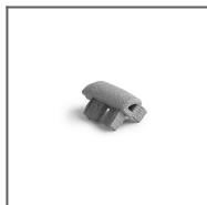
Záslepka STEKO-90 šedá Ref: 24053