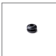
Gumová průchodka 6x1,2 Ref: 00802